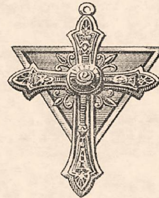
Joya Original del Maestro (primera Cruz del Maestro de la Orden Rosacruz que vino a América. - 1694)

La labor de Kelpius al frente de la comunidad rosacruz instalada a orillas del Wissahickon fue notable; dotado de un profundo conocimiento del misticismo llevó durante 14 años la enseñanza secreta de la Orden Rosacruz, elaborando rituales y ejercicios que dieron fuerza y valor a aquellos 40 entusiastas peregrinos que dejaron todo por producir un cambio en la evolución de la humanidad y se reintegraron a la comunidad para desarrollar sus propósitos de vida.