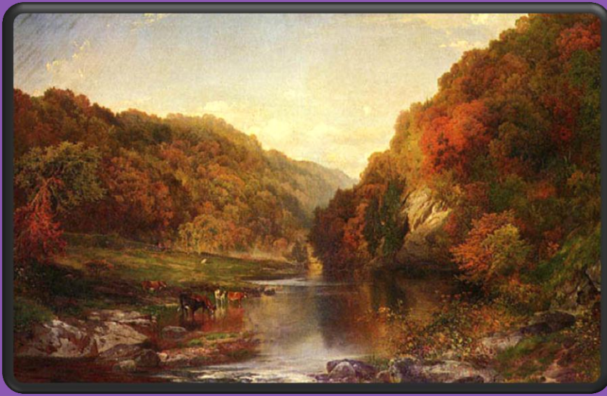
Otoño en el Wissahickon, por Thomas Moran.