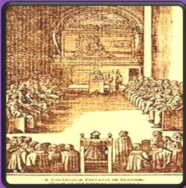
Conventículo Pietista en Alemania, Siglo XVII.

Aquellos que, como Kelpius, fueron verdaderos místicos son una minoría, incluso entre quienes le siguieron al Nuevo Mundo habiendo alcanzado un cierto entendimiento y experiencia directa de los principios Rosacruces y las leyes espirituales Universales. Como Rosacruces, siguieron participando en las prácticas religiosas personales y esfuerzos públicos lo que era una parte natural de la vida en América. Los Rosacruces han trabajado bajo muchos nombres en el pasado. Por ejemplo, es interesante observar que hubo otra tradición esotérica diferente y sin embargo, similar a la Pietista. En los siglos 12 y 13, los Albigenses o Cátaros del sur de Francia, también utilizaron el título de "perfecto" o "perfecti" para referirse a los miembros más avanzados de su fraternidad.